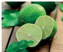
Sorbet Citron Vert