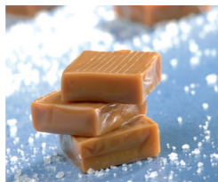
Caramel Beurre Sel de Guérande