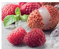
Sorbet Litchi Framboise