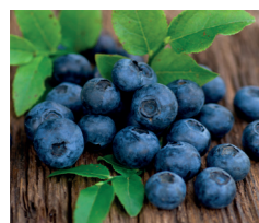
Sorbet Myrtille Sauvage