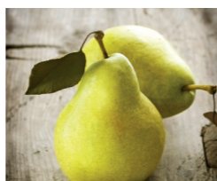
Sorbet Poire Williams de Savoie