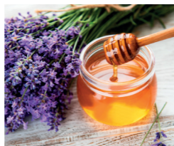
Miel de Provence IGP