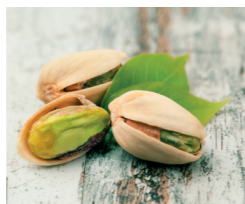
Pistache de Sicile