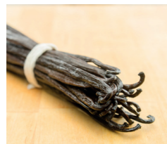
Vanille Bourbon de Madagascar