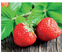
Sorbet Fraise Mara des Bois