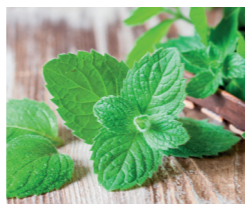
Menthe Blanche & Copeaux de Chocolat