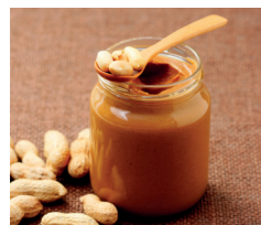
Cacahuète Rubans de Chocolat