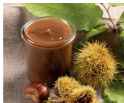
Crème de Marrons de l'Ardèche