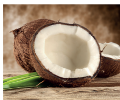
Sorbet Noix de Coco de l'Océan Indien